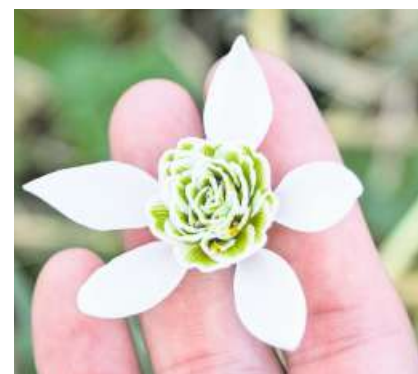
Die Blume Richard Ayres ist mit einer Rosette gefüllt.