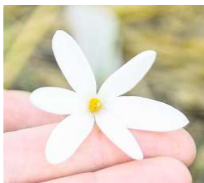
Die Schneeglöckchensorte Ice Bear hat sechs Blütenblätter.