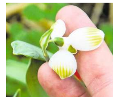
Eine eigene Züchtung von Yanik Neff, noch ohne Namen.