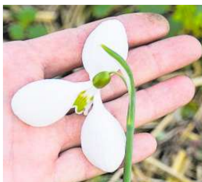
Eine Blume der Sorte Glenorma hat besonders breite Blütenblätter.